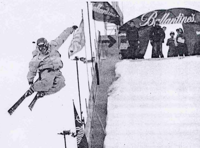
Las primeras demostraciones de esquí freestyle en el trampolín de Montjuïc, ayer, cargado de nieve artificial

Por partidas: 7,7 millones de euros han sido invertidos en remotes —un telesilla desembragable de seis plazas en La Molina, dos telesquís en Masella, 3 cintas transportadoras en Baqueira Beret, dos en Espot Esquí, una en Masella y otra en Vallter 2000—; 7,2 para la ampliación de producción de nieve artificial, cubriendo un total del 39% en las pistas de esquí alpino; y 10 pa-