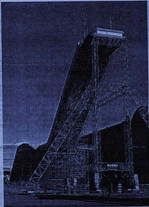
El espectáculo blanco correrá a cargo de los mejores riders del momento

Nivalia, del 17 al 19 de noviembre, estará ubicada en el palacio n.º 2 y la plaza Unvers del recinto de Montjuïc de Fira Barcelona. El salón reunirá en esta edición cerca de 120 expositores entre estaciones de esquí, fabricantes, distribuidores, material de ocasión, establecimien-