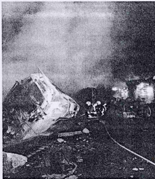
Los camiones accidentados, después de que se incendiaron

Las mayores colas de vehículos, de hasta cinco kilómetros, según informó Trànsit, se dieron en la AP-7, en sentido sur, pero también resultaron afectadas la B-30, a la altura de Cerdanyola del Vallès, la C-58, en la zona Montcada, la C-59, en el extremo más próximo a Mollet, y la AP-2, en El Papiol.