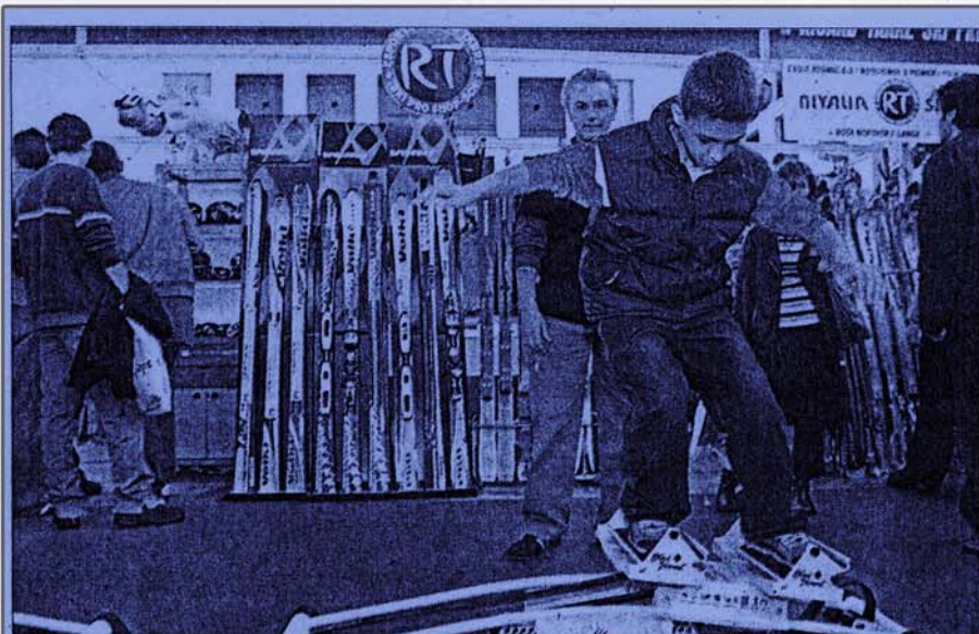
►► Un joven prueba el material en un stand de Nivalia, en una edición anterior.

►► Teodor Roviralta, 47. De 10.00 a 20.00 horas. Entrada libre. http://www.fundacio.lacaixa.es