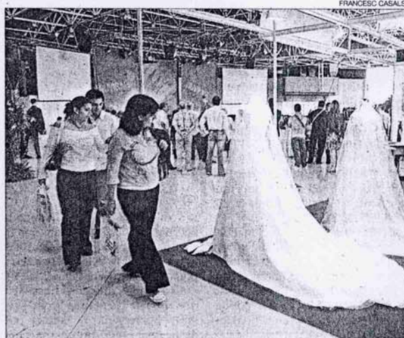
►► Visitantes del salón, en la edición del año pasado.

►► Avenida de la Reina Mª Cristina, s/n. De 10.00 a 21.00 h.; mañana, hasta las 20.00 h, 7,50 euros.