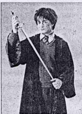
►► Escena de Harry Potter.

CosmoCaixa, el Institut de Cultura del Ayuntamiento de Barcelona y la Librería Laie organizan la segunda Muestra del Libro de Ciencia, que reúne textos de diferentes temas, didácticos y relacionados con las exposiciones del museo y otras actividades complementarias.