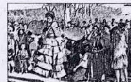
►► Los Xirriquiteula Teatre.