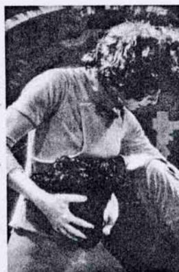
Un momento de «Nou I_D»