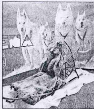
Un trineo antiguo en el 'stand' de Pirena.

Desde entonces se han creado un gran número de pruebas en las que mushers y perros compiten por llegar los primeros a la línea de meta.